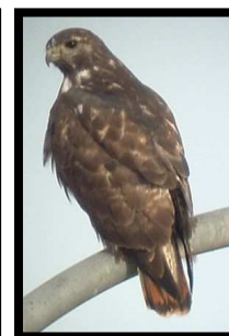
Cola roja (Harlan)