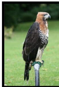
Hibrido A.real x Spizaetus Ornatus