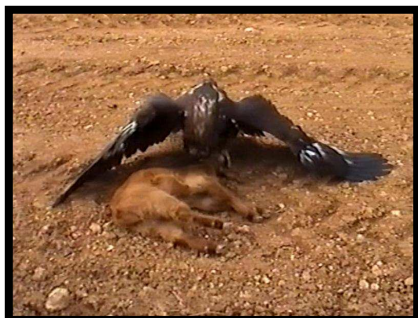
Águila Real con cabra

Son cazadoras versátiles. Pueden ascender a gran altura, para prospectar su territorio, o volar bajo intentando sorprender alguna presa. También caza al acecho como los azores. Como particularidad entre las aves cetreras, es la única que, viéndose apurada, come carroña.