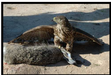
Azor pollo con una liebre

En cetrería se adiestra tanto subespecie autóctona como otras centroeuropeas y nórdicas de mayor tamaño. Es un ave extraordinariamente versátil. Muy utilizada en la cetrería por su mínimas exigencias en cuanto al terreno de caza y amplio abanico de presas.