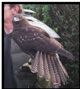
Hibrido Harris x Red tailer Harlan