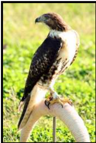
Prima de cola roja ( Red Tailer )

Tiene de envergadura entre 105-135 cm. Las hembras miden 50-65 cm y pesan 900-1460 gr. Los machos miden 45-56 cm y pesan 690-1300 gr. Presenta una coloración extraordinariamente variable, con la cola rojiza y el pecho de un tono más uniforme, es familia del ratonero común, pero con la cola mas larga y alas mas ancha, mayor tamaño y con mucha fuerza en sus manos, ideal para la caza de la liebre.