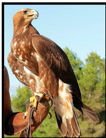
Aína Prima de Águila Real en exposición en el III Encuentro '09 del cetrero Manuel Pérez

Es de color marrón oscuro en todos sus plumajes, con la nuca más clara, pardo-rojiza clara o pardo-amarillenta. Su cola es larga, aproximadamente de igual longitud que su anchura alar.