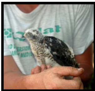
Pollo de gavián

Los jóvenes presentan el dorso marrón oscuro; observando de cerca se aprecian tonos rojizos en las plumas alares anteriores. El horizontal barredado de las zonas inferiores suele ser tosco, quebrado e irregular en el pecho. Su vuelo es más ligero y ondulante que el del azor.