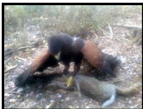
Prima de Harris con conejo

Como ave para iniciarse en bajo vuelo puede ser la más idónea.