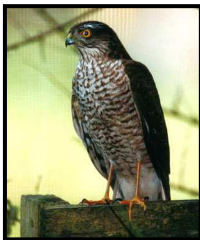
Prima de gavilán

Las hembras miden 35-41 cm teniendo una envergadura alar de 67-80 cm, pesan 185-342 gr. Los machos miden 29-34 cm, su envergadura es de 58-65 cm y pesan entre 110-200 gr.