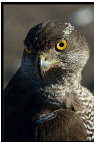
Azor con dos mudas

Las hembras miden entre 58-64 cm y tienen su envergadura alar oscila entre 108-127 cm, Pesan entre 820-1500 gr. Los machos 49-56 cm y su envergadura es de 93-105 cm llegando a pesar entre 510-1170 gr. En apariencia se parece a un gran gavián.