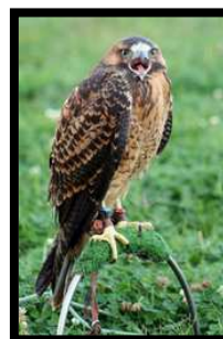
Ratonero del Perú