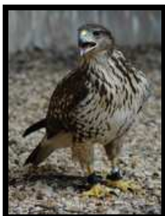
Hibrido Harris x Ferruginoso

Fortaleza, talla, resistencia, agresividad, formas, colores y un largo etcétera son las cualidades que buscamos con estos cruces.