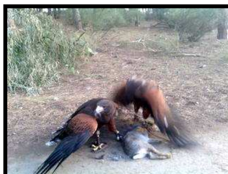
Copla de Harris con conejo

Muy utilizada en exhibiciones y exposiciones por su muy buen carácter y sociabilidad