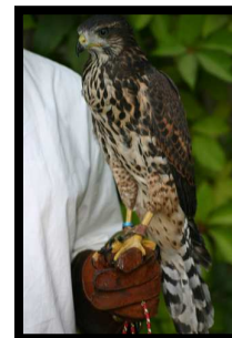
Hibrido Harris x Azor